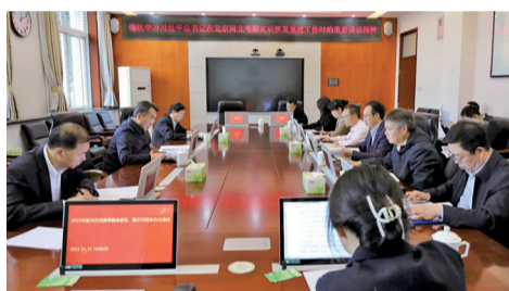
为北京地区农业农村灾后恢复重建工作贡献“北农力量”。

政府具体部署和要求,坚持以首善标准做好农业农村领域灾后恢复重建工作。要充分发挥学校办学特色以及人才、科技和资源优势,依托师生党支部与京郊农村党支部对接共建以及博士农场、科技小院、教授工作站、大学科技园等机制和平台,加强与北京受灾地区特别是广大农业农村受灾地区的对口支援与精准帮扶,全力支持帮助受灾地区推进乡村产业、人才、文化、生态、组织等五个振兴,持续